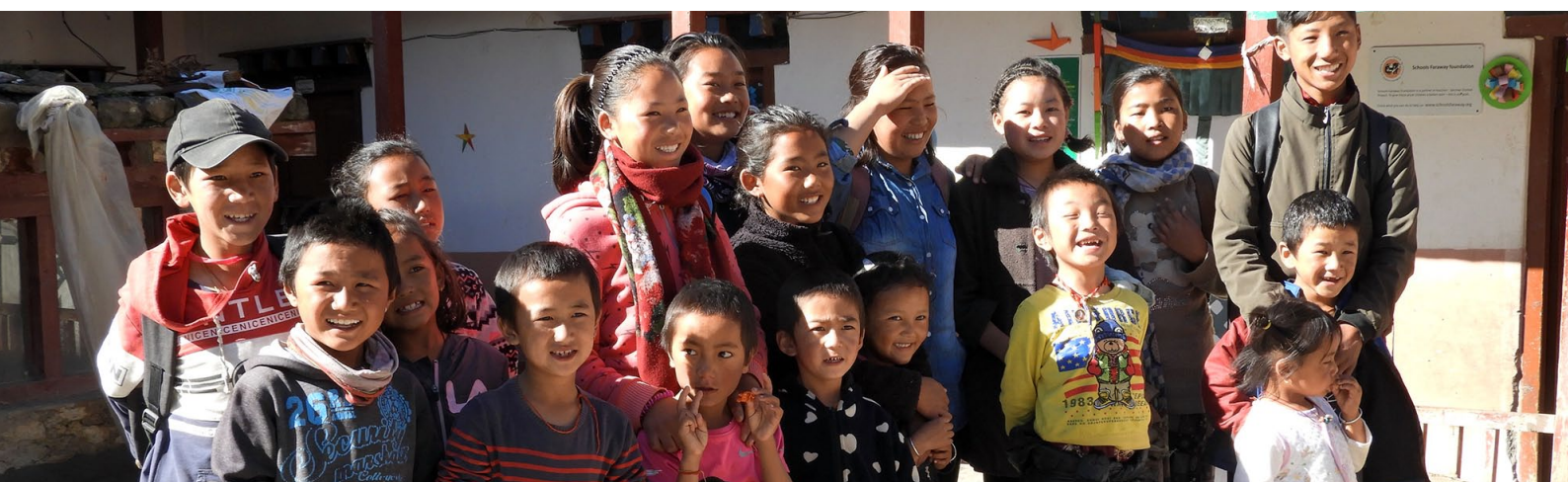
Vor etwa einem Jahr im Klosterhof von Jharkot – wir hoffen alle so sehr, dass die kleine Gemeinschaft bald wieder zusammenkommen kann