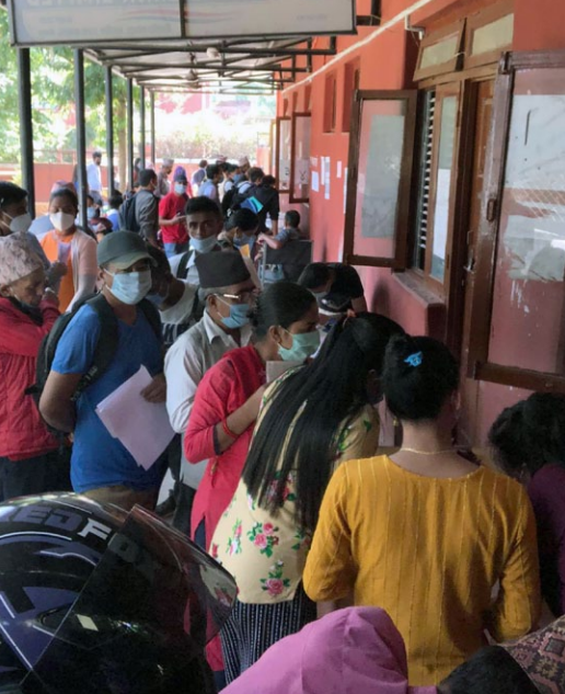
Die Warteschlange beim Geldabheben: Sichere Distanz geht oft nicht